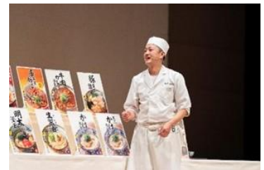
※写真は前回(第30回)の様子