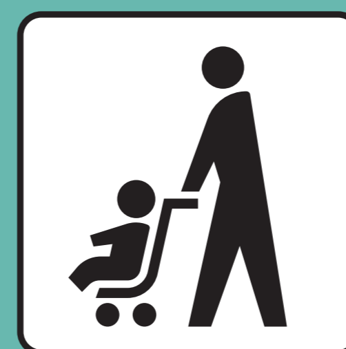
ベビーカーマーク