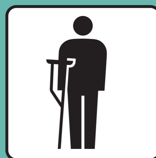
障害のある方 けがをされている方