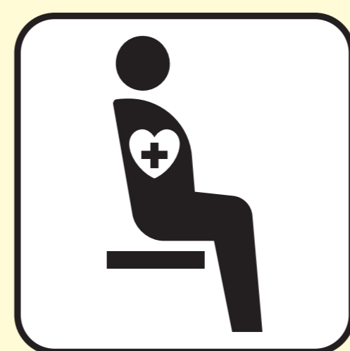
内部障害の ある方