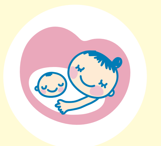
マタニティ マーク

改正バリアフリー法では、新たに鉄道等の優先席を含む、「高齢者、障害者等用施設等の適正な利用の推進」が国・地方公共団体・国民・施設設置管理者の責務となりました(令和3年4月施行)。