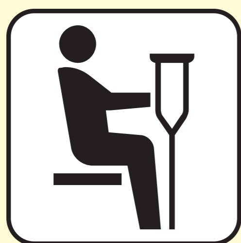
障害のある方 けがをされている方