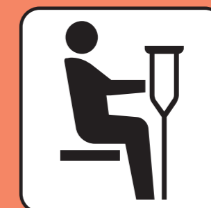
障害のある方 けがをされている方