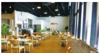
イトインスペース

新店舗の住吉店は買い物だけでなく、来店してもらえるような「地域のコミュニティの場」、「くつろぎの場」となる店を目指している。そのためイトインス