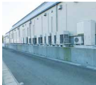
手前：エコキュート 奥：蓄熱式ショーケース室外機

同社は今後も、単に「売上高を増やす」ということではなく、出店する一店舗一店舗が地域の皆さまの暮らしをより豊かに、より快適に、より便利に守り育てることを目的に店舗運営を続けていく。