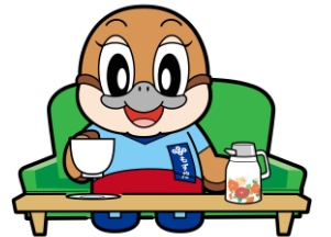
不要不急の外出自粛