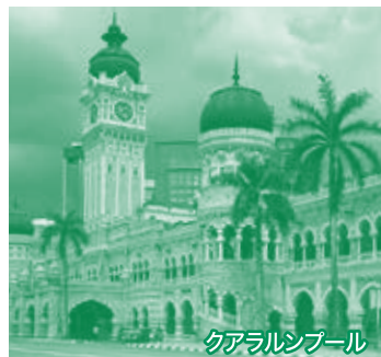
クアラルンプール