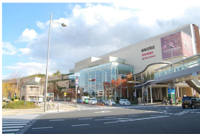
第5回日本SC大賞・金賞 『阪急西宮ガーデンズ』