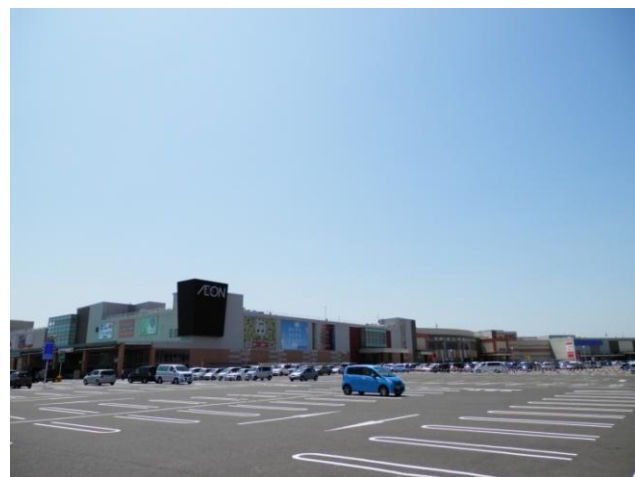
第3回地域貢献大賞(倉橋良雄賞) 『イオンモール石巻』