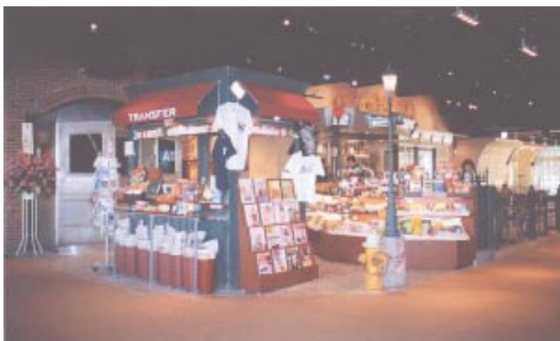
NYの空港や地下鉄駅を連想させる雰囲気雑貨&カフェ「TRANSFER」。海外の新聞や雑誌も売っている