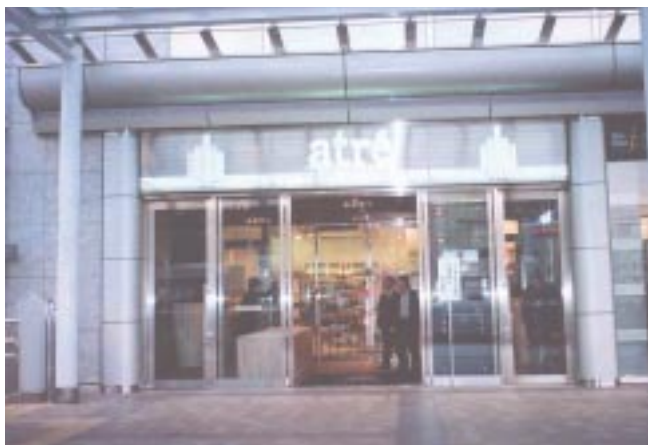
JR品川駅南口側ベデストリアンデッキからの入口。奥に見えるのはニューヨーカーに人気の「DEAN & DELUKA」。マンハッタンにある店舗とほぼ同じスタイルで出店

コミュニケーションテーマは“ニューヨーク スタイル”。ふと、自分のいる場所を忘れてしまいそうなニューヨーク スタイル気分を醸し出している。