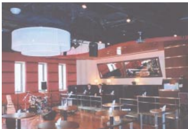
ジャズライブを楽しみながら食事を楽しむ「TRIBECA」