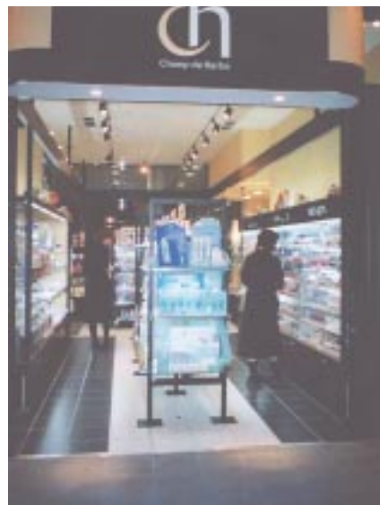
“セルフプロデュース志向”の女性のための、スタイリッシュなコスメショップ「シャン・ド・エルブ」