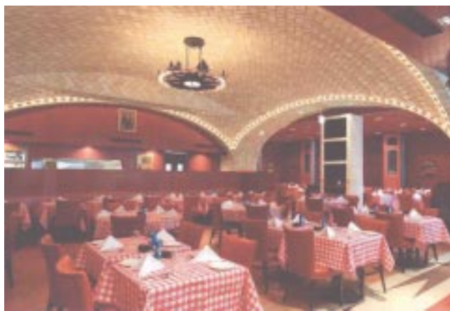
NYのグランドセントラルステーションにある人気の老舗オイスターバーの日本1号店となる「グランド・セントラル・オイスター・バー」