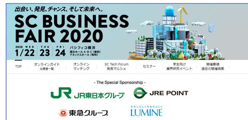
SCビジネスフェア公式WEBサイト(前回イメージ)