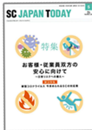
「SC JAPAN TODAY」

◆オンライン展示会の歩き方のような動画(あるいは資料)を作成し来場者の誘致を図ります。