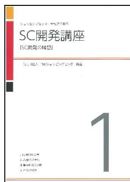
テキスト（デザイン例）

テキスト：2012年8月以降発行のテキスト（発行「一般社団法人日本ショッピングセンター協会」）