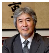
山極 壽一 京都大学名誉教授