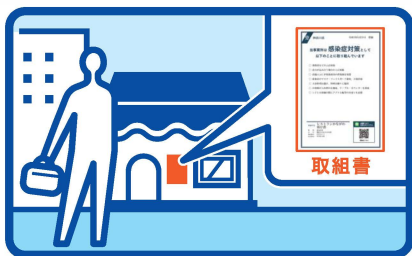
取組書は店先に掲示する