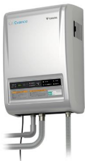
オゾン除菌脱臭機