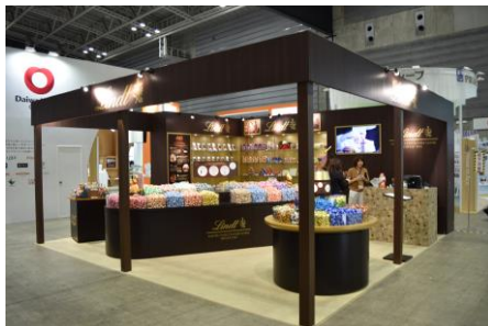
リンツ&シュプルングリージャパン