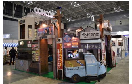
コンバートコミュニケーションズ