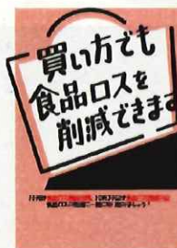
農林水産省 啓発チラシ