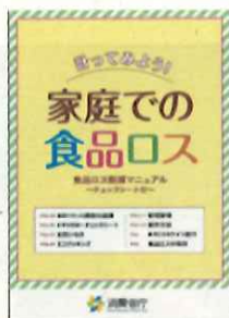
消費者庁 啓発冊子

消費者庁、農林水産省、環境省では、食品ロス削減のための啓発資材を作成し、配布しています。これらを活用して、取り組んでみましょう。