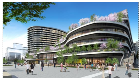
写真上: 「SAKURA MACHI Kumamoto」完成予想パース / 写真下: 施設断面図

※やむを得ない事由により、講師・時間割・講演内容等を変更する場合がありますので、あらかじめご了承ください。