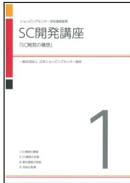
新テキスト(デザイン)

旧テキスト：2011年以前発行のテキスト（発行「社団法人日本ショッピングセンター協会」）