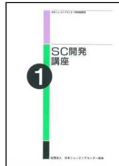
旧テキスト(デザイン)