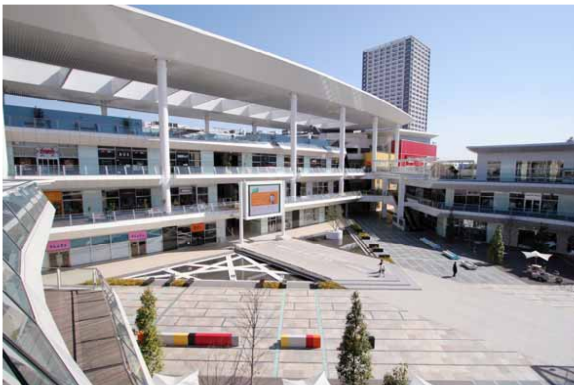
第4回「日本 SC 大賞 2010」 大賞受賞 「ラゾーナ川崎プラザ」(神奈川県川崎市)