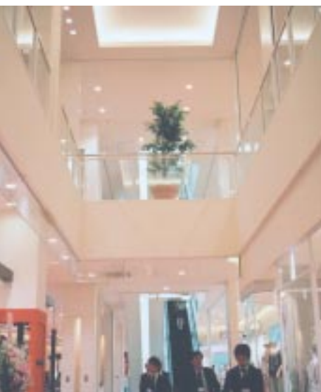
どのフロアも天井が高く、明るく、開放感がある。右はレディスファッションの「SM2(サマンサモス)」、左はアクセサリー「プラネットブルー」(2階)。