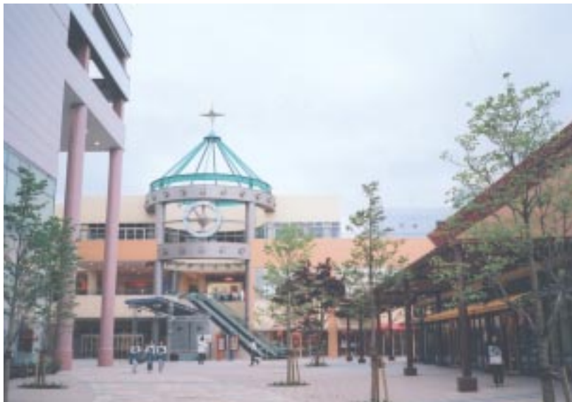
ウエストゲートから見た外観。左はキーテナントの「イトーヨーカドー」、右には花・ガーデニングの「fan」や雑貨の「karako」など、正面1階にはペットショップ「ペットランド」や雑貨「ペット&スマイル」、ベーカリー&カフェ「サンジェルマン」が入っている。

2004年4月28日(水)、さいたま市北部の宮原町に「ステラタウン」がオープンした。イトーヨーカドーを核に108の専門店(ステラモール)、大型専門店から成る県内最大級の大型SCである。施設のテーマは、「Warmth(心の温かさ・思いやり)」。①開放感あふれる空間の演出、②30代を中心にした、あらゆる層をターゲット、③ライフスタイルの多様なニーズに対応、④ふれあい型・参加型のイベントで身近な施設づくり、を主な特徴に、地域のお客様に愛されるSCを目指していく。