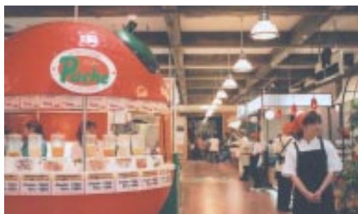
1階の一角には、市場感覚でテイクアウト店が並んでいる。左の巨大なオレンジは、10台のミキサーが並ぶジューススタンド「Peach(パチニ)」。