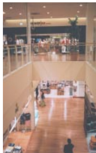
正面は、(株)ワールドが展開するジーニングカジュアルブランド「THE SHOP TK TAKO KIKUCHI」(3階)。