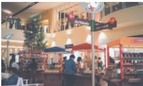
2階にある「センターコート」。2街区にある大型専門店(ルーム・スズ大正堂(2階)、マックスアイローハット、ザ・ダイソー(1階)への連絡ブリッジも、この階にある。ワゴンショップの横には、星をイメージした、かわいいサインやベンチ、インフォメーションなどがある。