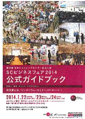
公式ガイドブックイメージ (写真は 2014 年度版)