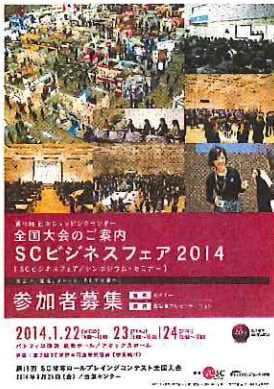
セミナー参加者募集 パンフレットイメージ (写真は 2014 年度版)

体 裁 A3 発行日 2015 年 1 月 21 日 印刷部数 43,000 部